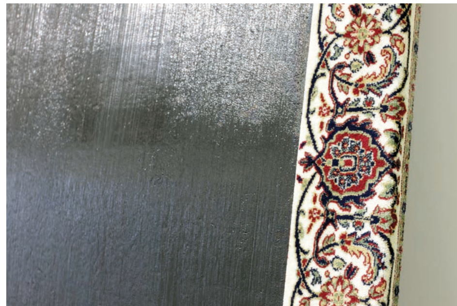
Border. 2017. Alfombra, óleo y madera.